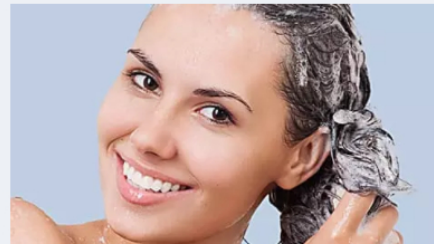
הקרפף לא מפסיקה לגרד? הערכה שתשים לזה לטוף קמדיס | ממומן