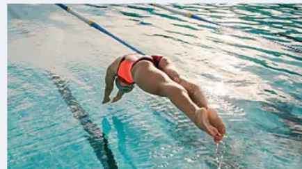
שיטת TI לשיפור סגנון השחייה מקנה אורח חיים בריא המתאים לכל אחד TI Swim