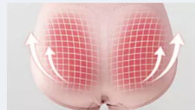
הסוד אותו הסלביס לובשות וכך מתגאות בבטן שטוחה וישבן מורם Health MAGIC Pants