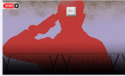
"כולם קראו לו 'ילד פלא', כל דבר שנגע בו הפך לזהב": מי אתה, סרן איקס? ynet+