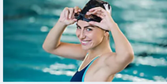
10 שיעורים ותלמדו לשחות כמו מקצוענים, בהתחייבות!