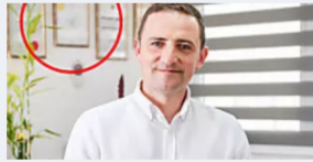
דרמה בביטוחים: מנכ"ל סוכנות לביטוח חושף את השיטה לאיתור ... לחצו כאן