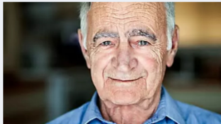
מס הכנסה החליט לפטור את הפנסיונרים ממס רווחי הון לירות המבזין | ממומן