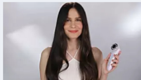
מהפכה בעולם הקוסמטיקה! ממומן