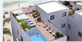
הישראלים קונים ביוון: דירת יוקרה על קו החוף החל מ-55,000 יורו ב... Channel22