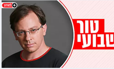
וושנינגטון מחכה לממשלת בנט-לפיד / נדב איל ynet+