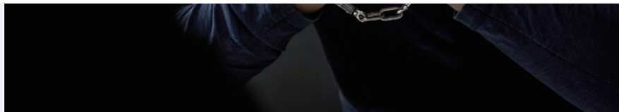
זה יכול לקרות לכל אחד

תיכף תוכלו להתקשר לבן הזוג. לאמא. לעבודה, להסביר איך קרה שלא הנעתם היום. תאלכו ארוחת ערב חמימה. תעשו מקלחת! אחרי כן יהיה בסדר. תפתרו את זה כבר. יש עורכי דין. השופט הרי בטוח יבין שלא באמת ייתכן שעשיתם את זה. יש צדק.