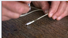
כלי העבודה היעיל ביותר הגיע לישראל Bondic